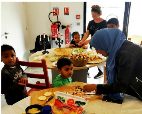
Atelier nutrition- Semaine parentalité