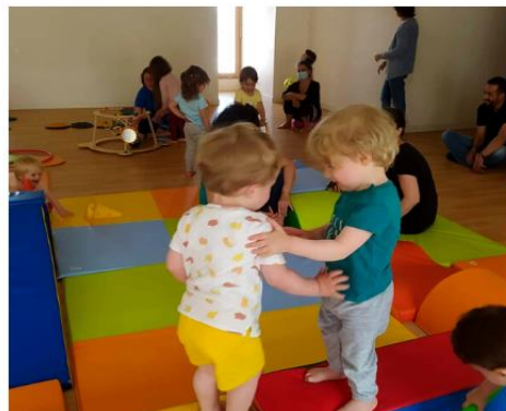
Baby Gym- Année 2021-2022