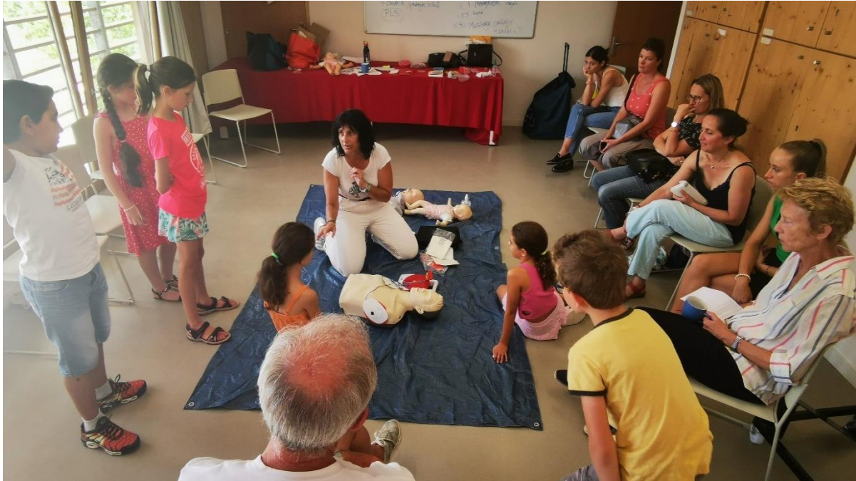
Initiation aux gestes de 1 er secours CLAS 2021-2022 Partenariat avec la Mutualité Française de l'Occitanie

Accompagner les parents dans leur rôle, soutenir les familles en difficulté, faciliter leur quotidien.