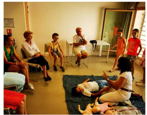
Initiation 1 er secours- CLAS 2021-2022