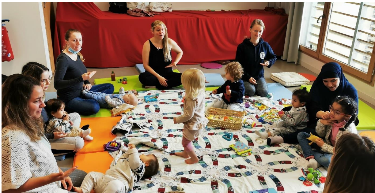
Atelier parent – enfant « Signes avec bébé »