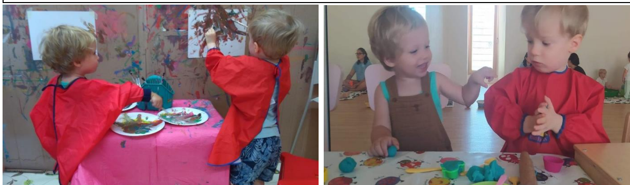
Atelier parent – enfant « Eveil des sens »