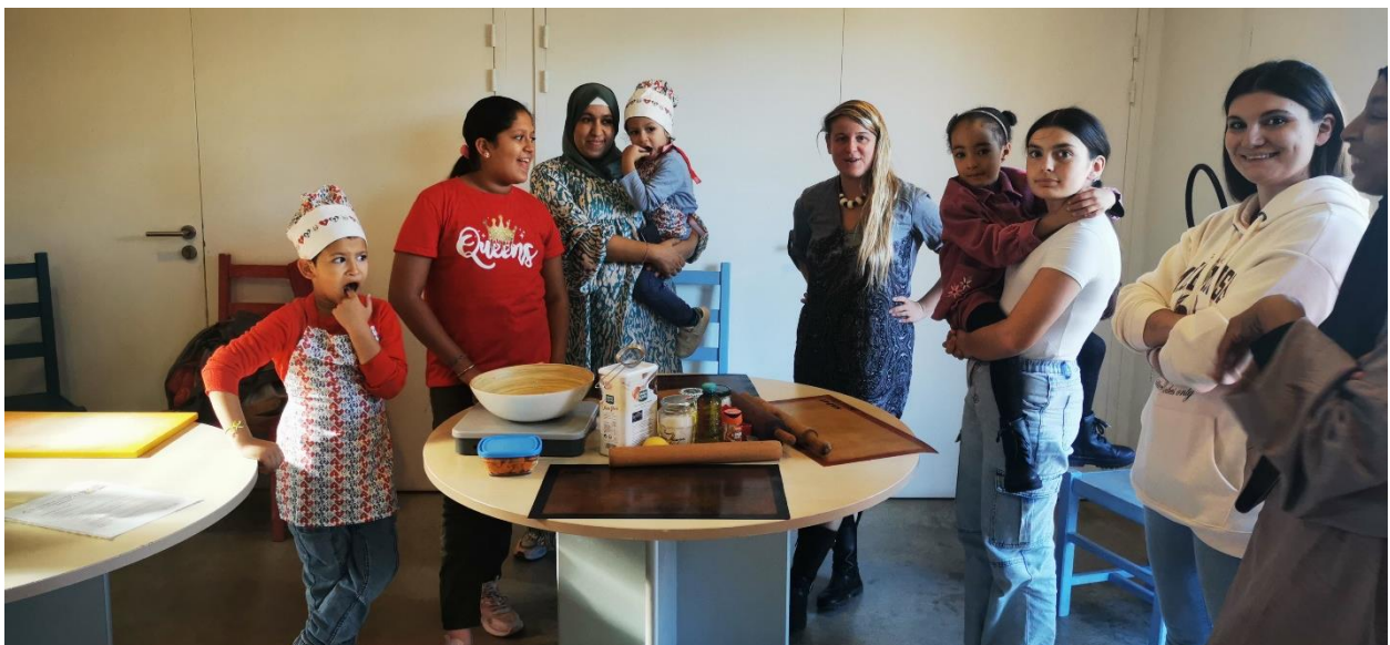
Rencontre-Thématique parentalité « Quelles alternatives aux goûters industriels ? » avec l'intervention de l'association « La Cantina » (nouveau en 2023)