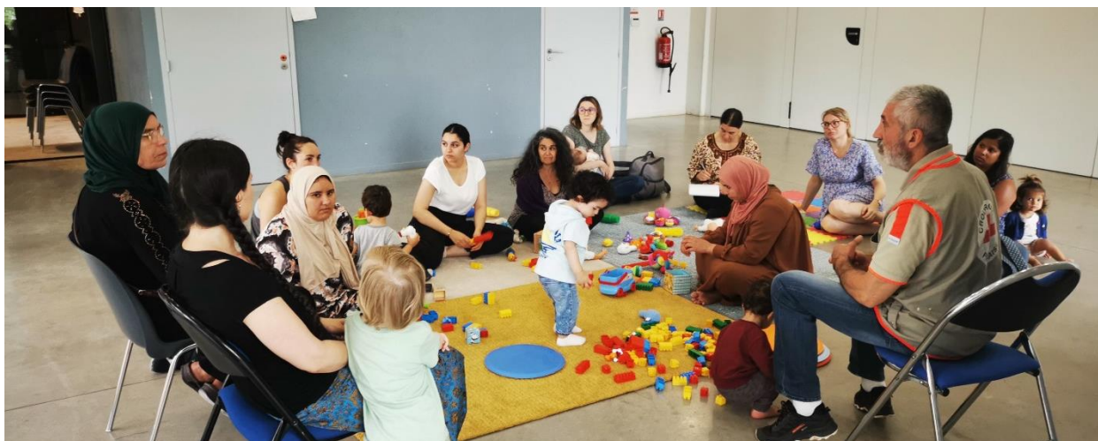
Atelier parentalité, prévention et 1er secours avec l'intervention de la Croix Rouge (Nouveau en 2023 action REAAP)