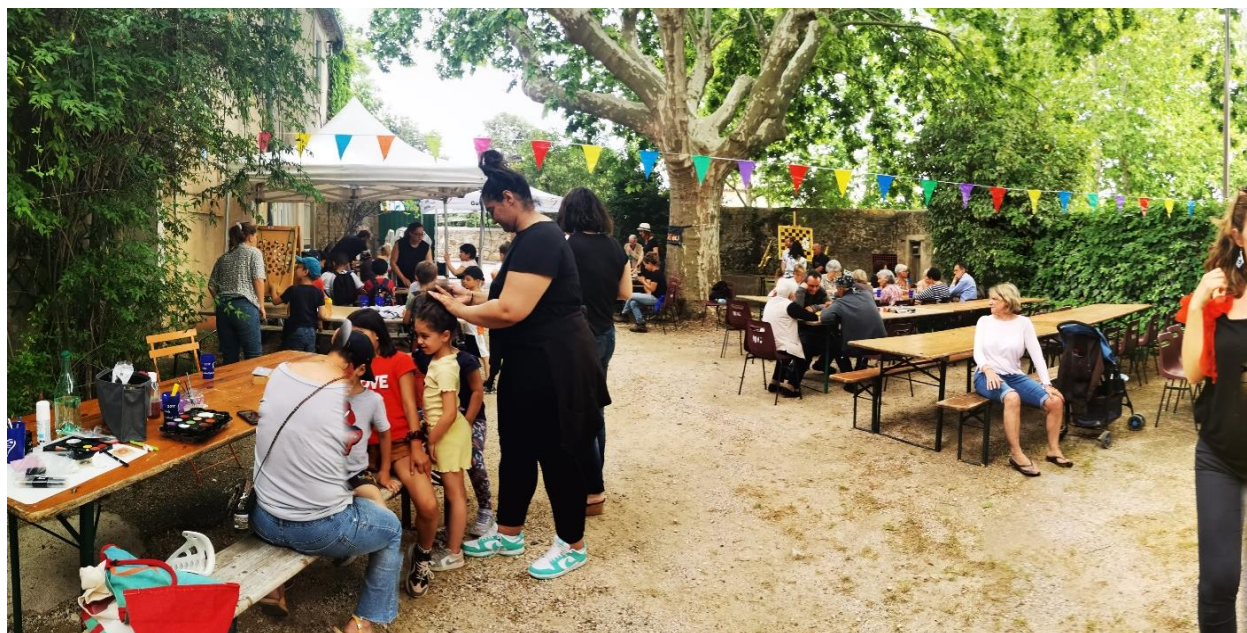
Fête intergénérationnelle du jeu -mai 2023