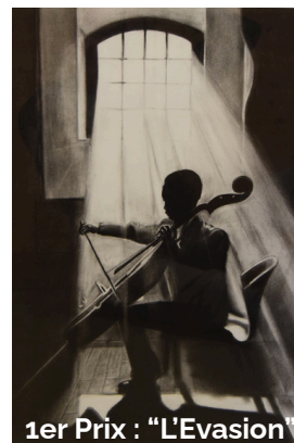
1er Prix : "L'Evasion"